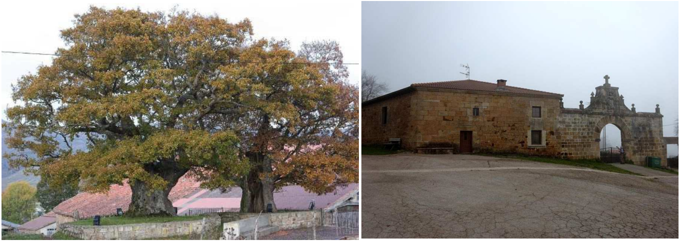
Lanchares: Robles centenarios ( Quercus robur L.) y Casa de los Arcos (del siglo XVII).

Justo al llegar a la carretera de acceso a este pueblo, de frente en La Uquía, se pueden ver Los Roblones, dos magníficos ejemplares de robles centenarios.