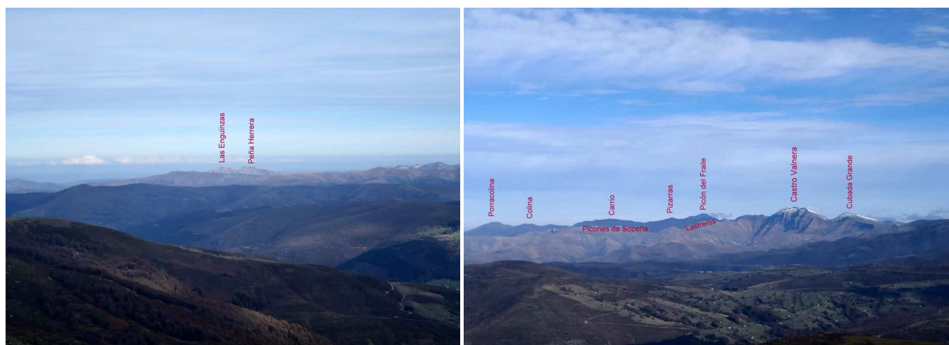
Vistas desde Mediajo Frío: Al NE y al E-NE.

Se continúa hacia el NE bajando por un pernal con fuerte pendiente al Collado Agualateja (1094 m), para subir, a continuación hasta cruzar el Arroyo del Mojón, por su cabecera. En este momento el camino da un brusco giro a la izquierda quedando en dirección O-NO. Se continúan otros 250 m por este camino, para dejarlo y tomar el cortafuegos que sale a la derecha (NE), subiendo con fuerte pendiente hasta la cumbre del Mediajo Frío (1328 m)