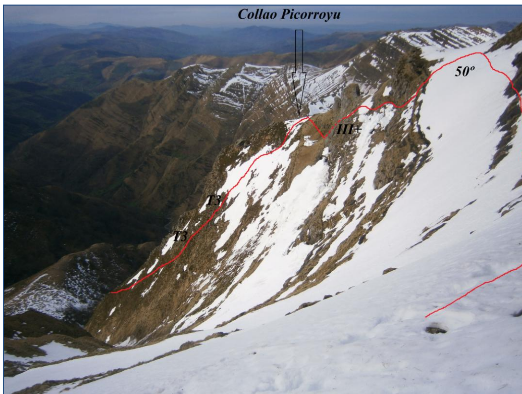
Gran tramo de unos 200m de ensamblada con dos tramos de T3

- Comienza una ensamblada de unos 200m por terreno de aventura, difícil de proteger y que presenta un par de resaltes de T3, a lo que se suma el peso de las cuerdas rozando por escajos y brezos. Llegamos a un colladete (Picorroyu, a unos 1.460m).