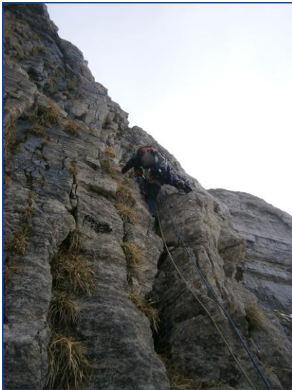
Abriendo el IV+

- Largo de 20m con muro de roca de V y salida a campa de verde de 35º. Éste tramo se puede evitar 50m a la izquierda por un embudo evidente sin aparentes complicaciones.