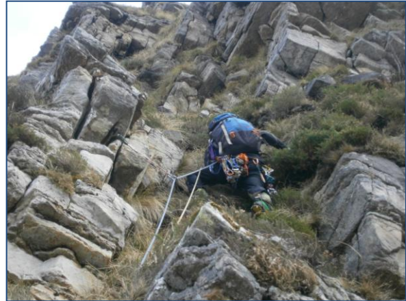
Otro largo de M4

- Comienza una ensamblada de unos 200m por terreno de aventura, difícil de proteger y que presenta un par de resaltes de T3, a lo que se suma el peso de las cuerdas rozando por escajos y brezos. Llegamos a un colladete (Picorroyu, a unos 1.460m).