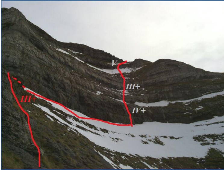
Segunda ensamblada y tramo final dos tramos de T3