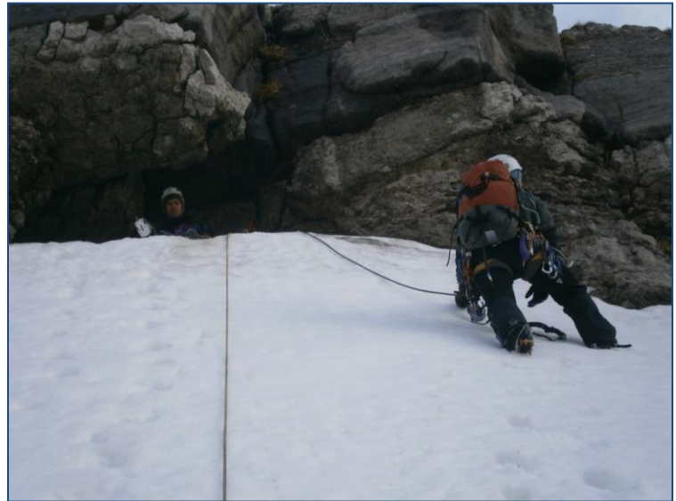
Nicho a pie del tramo de V