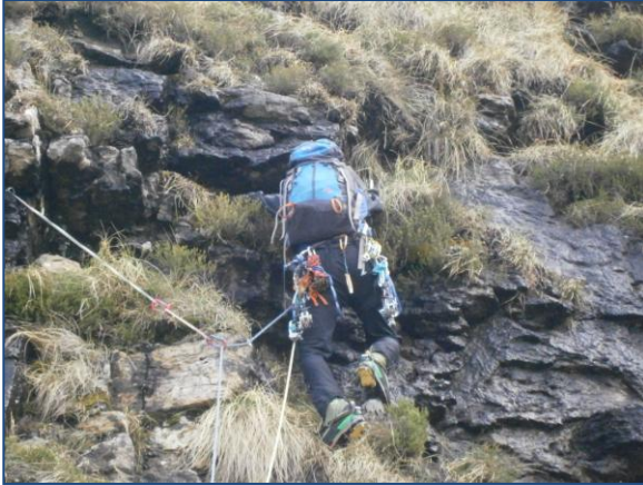
Primer tramo de M4 de la vía