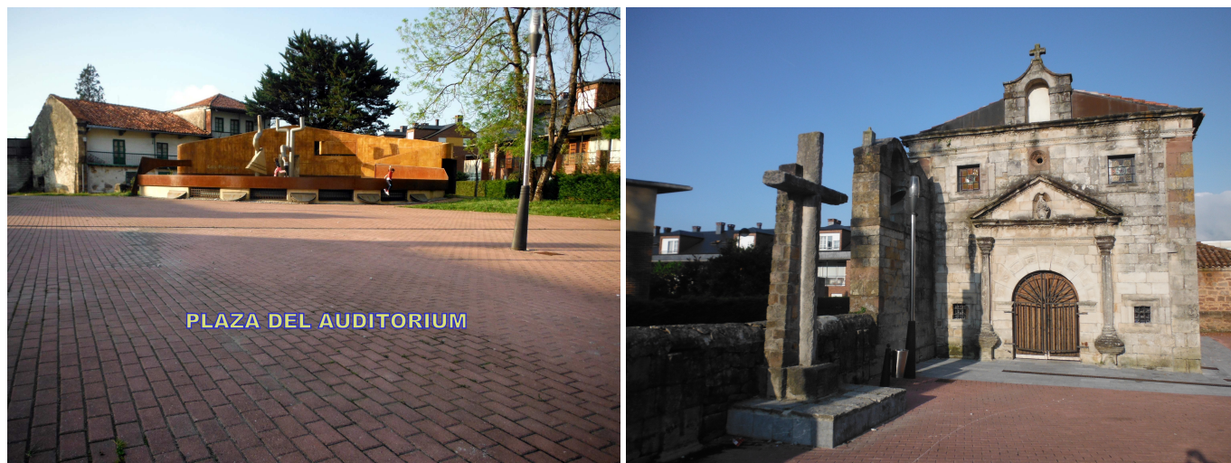
Plaza del Auditorium y Ermita de Santa Ana, en Tanos.

Enseguida se pasa junto a una gran nave ganadera (izquierda), a la vez que se deja a la derecha el Área Recreativa de La Pedrosa (130 m), un lugar donde han colocado mesas y barbacoas dentro de un ralo bosque. Al poco rato, se pasa junto a dos casas, donde hay un cruce múltiple, siguiendo por el camino de la derecha (O-SO) y tomar el siguiente que se encuentra a la izquierda (SE).