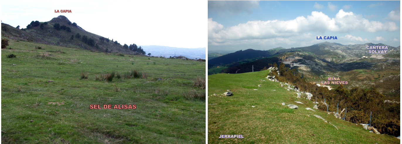
La Capía vista desde el Sel de Alisas y vista general de la parte superior del Monte Dobra.

Collado Campo Solares (284 m), donde finaliza el pernal NE del Alto de Jerrapiel (399 m). Este último tramo discurre junto a las profundas excavaciones que se ha realizado durante la explotación de las minas es la zona, que quedan a la izquierda.